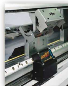
Piegatrice LVD con Easyform Da 135 TON L 3000 9 ASSI Computerizzati

Le lavorazioni che possiamo eseguire sono: